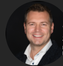
WISTIK ZONNENBERG Register Makelaar/Taxateur Eigenaar

Warmwater- en verwarmvoorziening: Nefit cv-keter/boiler Vloerverwarming: aanwezig met radiatoren en convectoren zonnepanelen: 12 stuks openhaard: aanwezig Voorzieningen: buitenzonwering, souterrain en vliering Mechanische ventilatie: aanwezig Isolatie: dak/spouw/vloer Dubbelglas: geheel Glasvezel kabel en TV kabel Kozijnen: hardhouten kozijnen